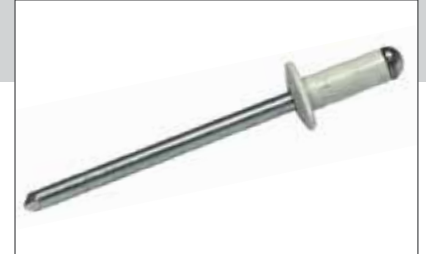
EN AW - 5052 [AlMg2,5]