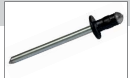
EN AW - 5052 [AlMg2,5]