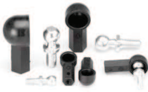
Abmessungen wie WGRM, Seite 51.25

Internet: www.igus.de E-Mail: info@igus.de