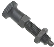
无锁紧螺帽 ZS53A ZS53AE